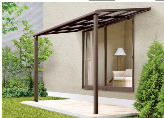
1階設置型 600タイプ 標準桁使用 2間×5尺 色：オータムブラウン 屋根材：ポリカーボネート板(クリアブルー) ¥131,700