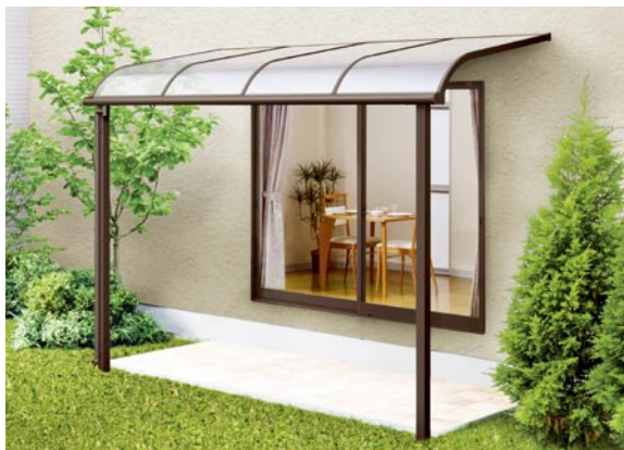
1階設置型 600タイプ 標準桁使用 2間×5尺 色：オータムブラウン 屋根材：ポリカーボネート板(クリアブルー) ¥139,100