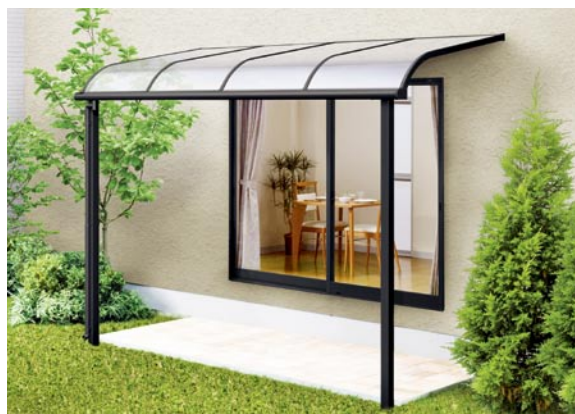
1階設置型 600タイプ 標準桁使用 2間×5尺 色：ブラック 屋根材：ポリカーボネート板(クリアブルー) ¥139,100