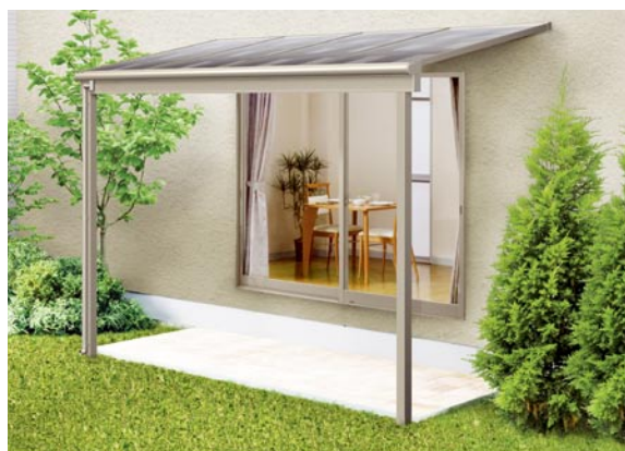
1階設置型 3000タイプ 標準桁使用 2間×5尺 色：シャイングレー 屋根材：ポリカーボネート板(クリアブルー) ¥183,200