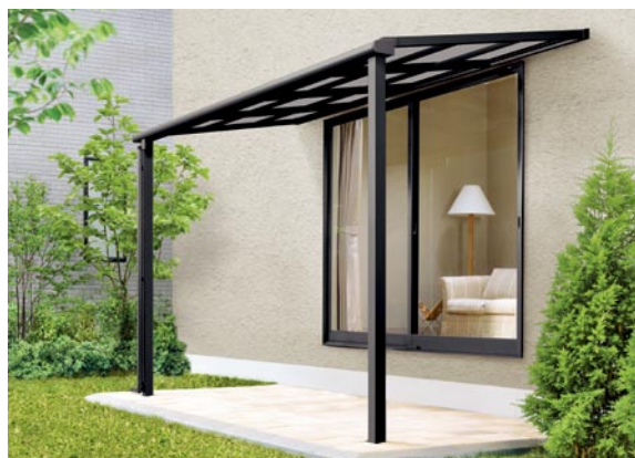
1階設置型 600タイプ 標準桁使用 2間×5尺 色：ブラック 屋根材：ポリカーボネート板(クリアブルー) ¥131,700