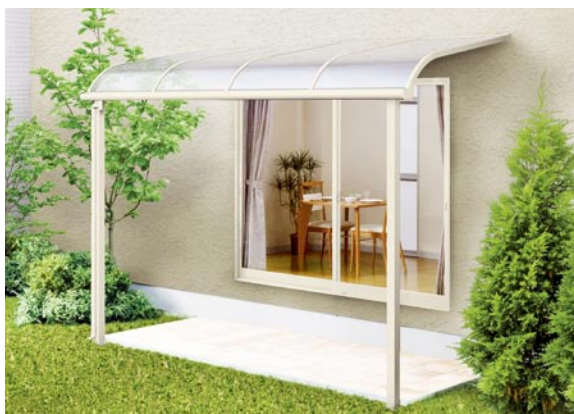
1階設置型 600タイプ 標準桁使用 2間×5尺 色：アイボリーホワイト 屋根材：ポリカーボネート板(クリアブルー) ¥139,100