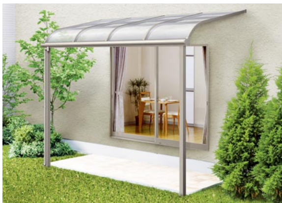
1階設置型 1500タイプ 標準桁使用 2間×5尺 色：シャイングレー 屋根材：ポリカーボネート板(クリアブルー) ¥157,600