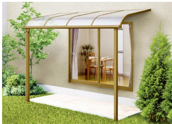
1階設置型 600タイプ 標準桁使用 2間×5尺 色：ブロンズ 屋根材：ポリカーボネート板(クリアブルー) ¥139,100