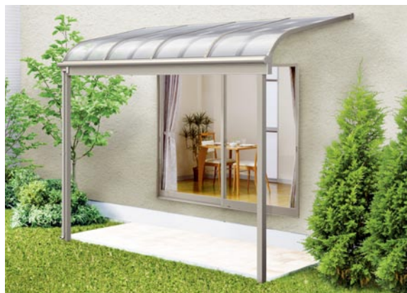
1階設置型 3000タイプ 標準桁使用 2間×5尺 色：シャイングレー 屋根材：ポリカーボネート板(クリアブルー) ¥205,900