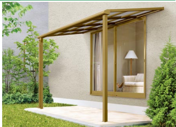
1階設置型 600タイプ 標準桁使用 2間×5尺 色：ブロンズ 屋根材：ポリカーボネート板(クリアブルー) ¥131,700