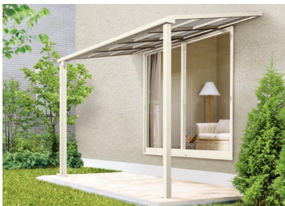
1階設置型 600タイプ 標準桁使用 2間×5尺 色：アイボリーホワイト 屋根材：ポリカーボネート板(クリアブルー) ¥131,700